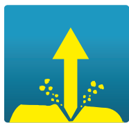
ПЕРВОНАЧАЛЬНАЯ ЭНЕРГИЯ РОСТА

Гибрид кукурузы зернового направления. Характеризуется высокой стабильностью на разных типах почв и при разной интенсивности технологии.