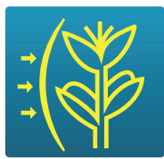
УСТОЙЧИВОСТЬ К ПОЛЕГАНИЮ